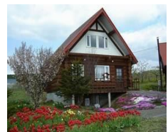
イルムの丘ユースファームコテージ