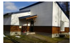
アグリ工房まあぶコテージ