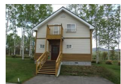
まあぶオートキャンプ場コテージ