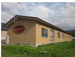
深川市移住体験住宅 「四季の丘 おとえ」 1・2号室