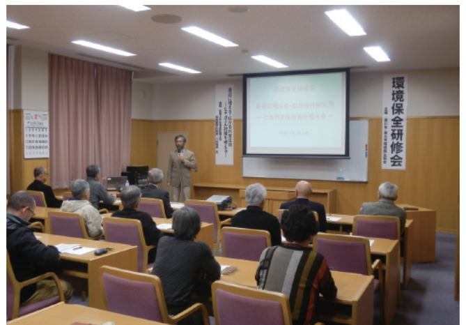
環境保全研修会（国内外来種「アズマヒキガエル」 について）