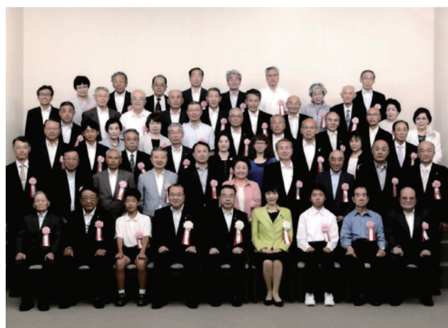
地域環境美化功績者環境大臣表彰