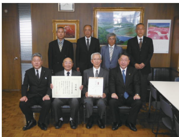
北海道環境保全活動功労者表彰