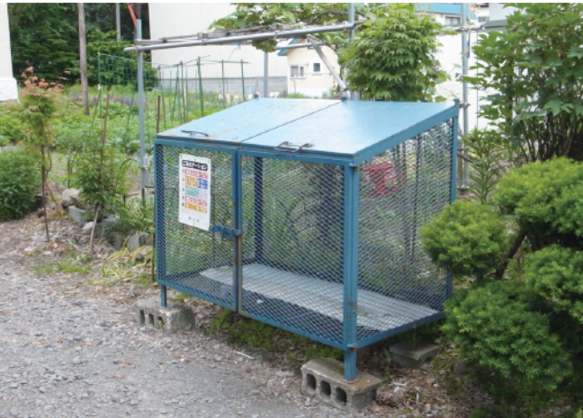
ごみボックス設置等助成