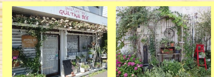
①雑貨カフェバー キルティングビー ＊公開期間＊ 5月下旬～9月下旬（終日） ＊花の種類＊ クレマチス、アジサイ、宿根草 他 店舗前と駐車場の小さなスペースですが、街中でホッとできる場所になればと思っています。宿根草中心のナチュラルガーデンです。