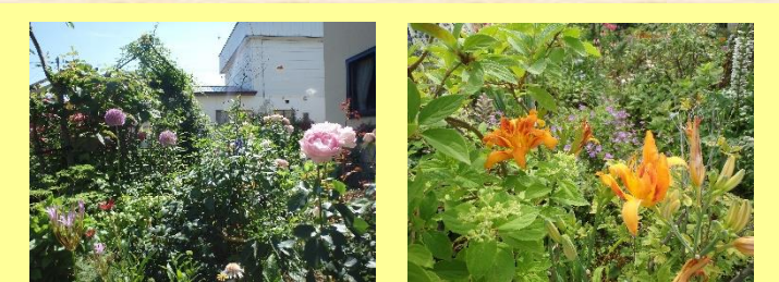
⑬榎邸 ※一声かけて下さい。 ＊公開期間＊ 6月10日～8月30日（8:30～17:30） ＊花の種類＊ 球根植物、エキナセア、熊がい草 他 多数の宿根草が次々と咲いてきます。静かに咲く秋の山野草も気に入っています。どうぞお立ち寄りください。