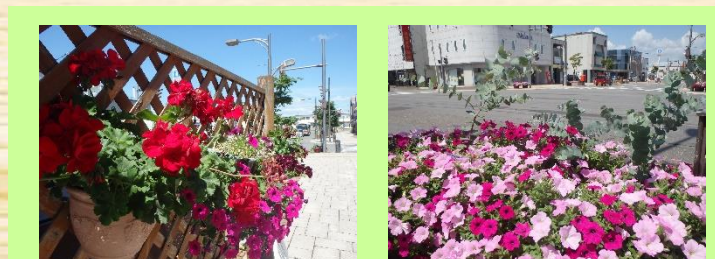
②深川市商店街振興組合連合会 ＊公開期間＊ 6月5日～9月下旬（終日） ＊花の種類＊ ラテリーナ 他 花と緑のあふれる商店街でゆっくりと楽しめるようにベンチ等を用意しています。