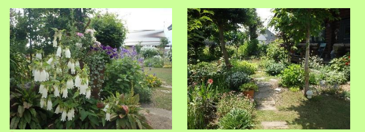
⑧野澤邸 ＊公開期間＊ 6月1日～7月31日（終日） ＊花の種類＊ ポピー、カラー、仙人掌 他 春一番にノードロップ、福寿草が雪の中から顔を出し、次から次と雪の降るまで何かしら咲いているそんな宿根草主体の庭です。