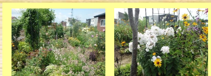
③梅木邸 ＊公開期間＊ 5月下旬～7月31日（終日） ＊花の種類＊ フロックス、カマツシア 他 いつもと変わらず宿根草メインの庭です。道路に面した庭ですので、散歩がてら見てください。