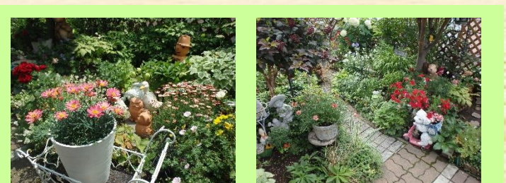
⑥堀邸 ＊公開期間＊ 6月1日～8月31日（9:00～15:00） ＊花の種類＊ クリスマスローズ、ゼラニウム 花壇、プランターの花もたくさん咲き、毎日が楽しみです。