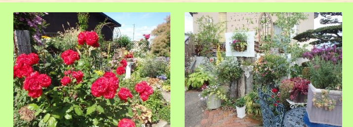
⑭山崎邸 ＊公開期間＊ 6月1日～7月31日（9:00～17:00） ＊花の種類＊ クリスマスローズ、クレマチス、山の草 他 宿根草主体の庭で狭い庭ですが、春から秋まで咲くので、自分なりに楽しんで癒されます。