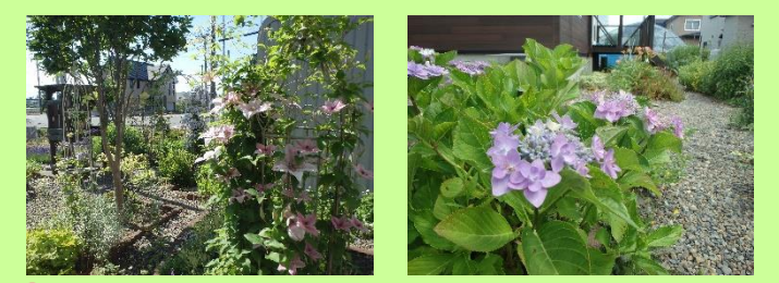
⑫吉村邸 ＊公開期間＊ 6月1日～7月31日（終日） ＊花の種類＊ 山アジサイ、ヘメロカリス 他 宿根草メインの庭です。花だけでなく、葉のきれいさも楽しんでいます。