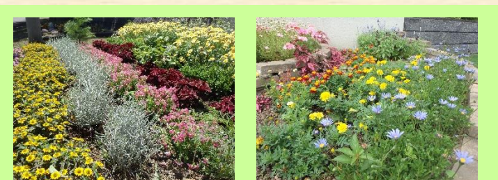
⑩北海道深川東高等学校 ＊公開期間＊ 5月22日～9月27日（9:00～16:00） ＊花の種類＊ マリゴールド、サルビア、コリウス 他 生徒が実習で植栽した花壇です。しっかり手入れしたいと思います。