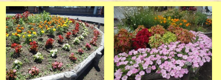
⑨深川市立病院（混SUN-CLUB） ＊公開期間＊ 6月10日～9月30日（終日） ＊花の種類＊ チューリップ、ムスカリ、ネモフィラ他 主に一年草です。いつでも咲いています。