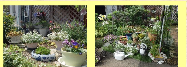
⑤前川邸 ＊公開期間＊ 6月1日～8月31日（終日） ＊花の種類＊ パンジー、アリッサム、マーガレット 他 草花いろいろ植えてます。手作りです。種から植えてその他もあり楽しんでいます。