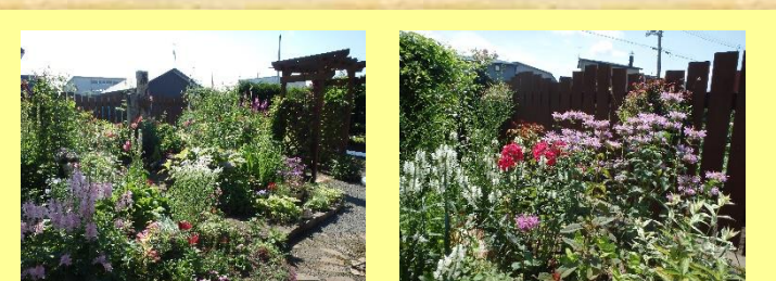
⑪江崎邸 ＊公開期間＊ 6月20日～7月31日（終日） ＊花の種類＊ バラ、クレマチス、宿根草、一年草 他 お花の中に隠れるように佇んでいる小動物達を見つけいただきながら、自由にお楽しみください。