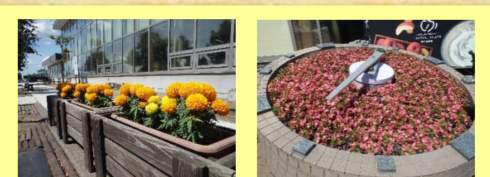
⑮道の駅ライスランドふかがわ ＊公開期間＊ 5月下旬～9月下旬（終日） ＊花の種類＊ マリゴールド、ペコニア 他 大輪のマリゴールドや色鮮やかなペコニアは見応えあり！ご来館お待ちしております。