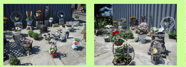
④中山邸 ＊公開期間＊ 6月1日～7月31日（終日） ＊花の種類＊ ヒメカリス、サルファークィーン、ネモフィラ 他 小さい花がメインのガーデニングです。 ストーンアートとお花のコラボをお楽しみください。