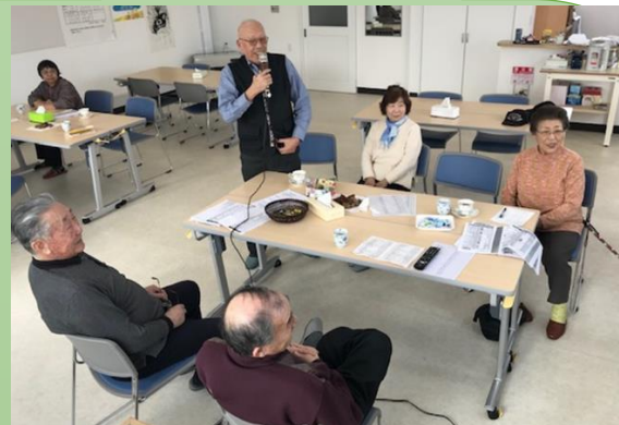
カラオケ (毎週月曜日)