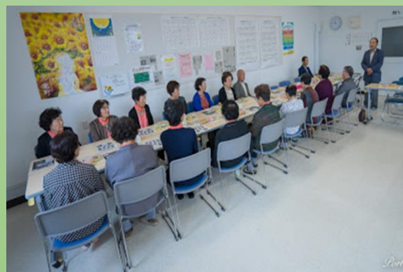
ひとり暮らし昼食会 (毎月第 2 木曜日)