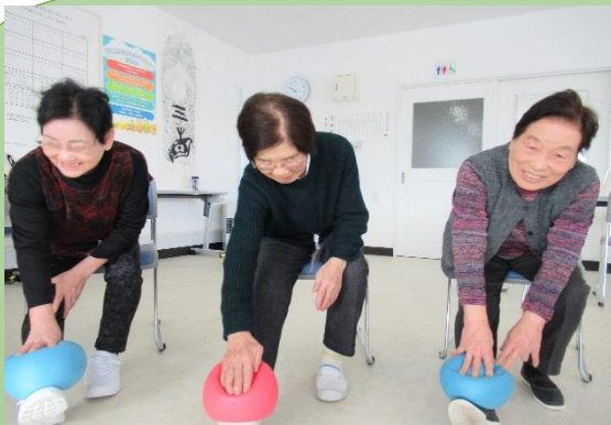
まる元 (毎週火曜日)