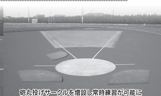
砲丸投げサークルを増設し常時練習が可能に