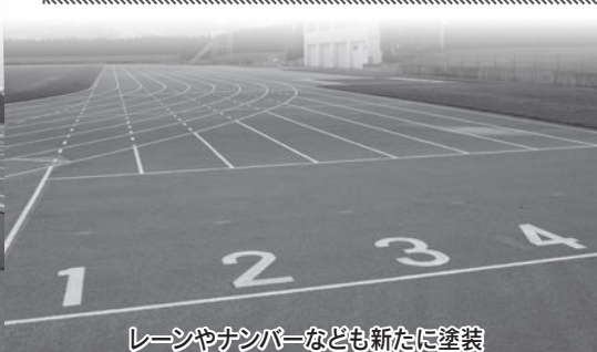
レーンやナンバーなども新たに塗装