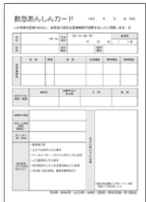
▲救急あんしんカード (見本)