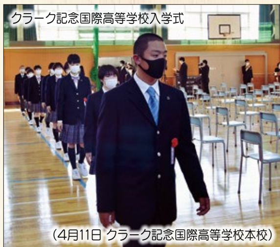
クラーク記念国際高等学校入学式