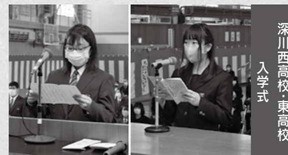
深川西高校・東高校 入学式

平成30年5月に地域おこし協力隊として着任し、野菜の栽培やふかがわパークの加工品製造に携わってきましたが、あっという間の3年間でした。苦労することもありましたが、みなさんの温かさに助けられながらさまざまなことを学ぶ中で、深川市に貢献したいという思いが強くなり定住を決めました。今後は㈱深川未来ファームの社員としてふかがわパークの新商品の開発や魅力向上に努めます。