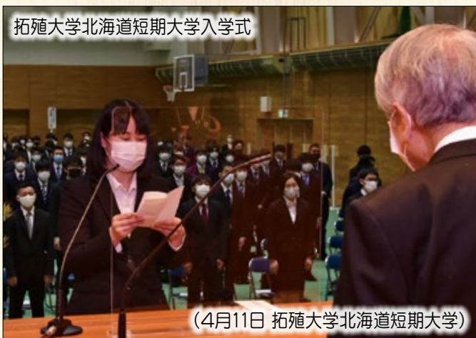
拓殖大学北海道短期大学入学式