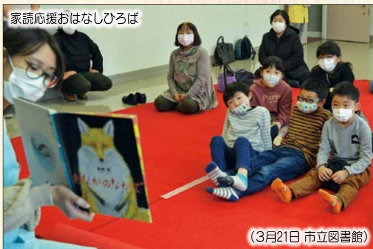
家読応援おはなしひろば