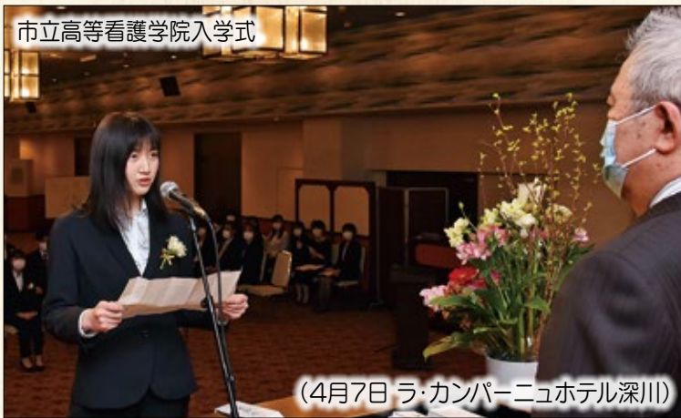
市立高等看護学院入学式