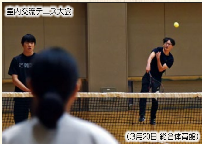
室内交流テニス大会