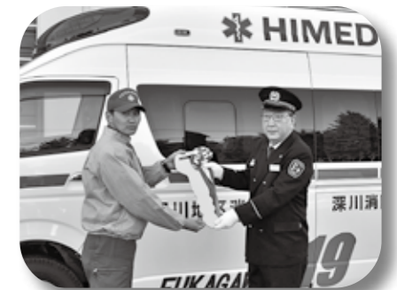
▲災害対応特殊救急自動車納車式 (3月19日 消防総合庁舎前)