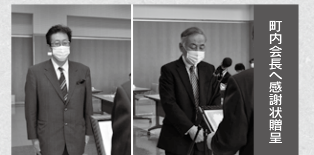
町内会長へ感謝状贈呈

深川西高等学校と深川東高等学校の入学式が4月8日にそれぞれ開催されました。式中の新入生宣誓では、代表生徒が、新しく始まる高校生活への抱負を力強く述べていました。