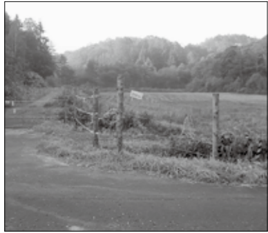
電気柵を設置している農地

エソシカによる農作物などへの被害の多い市内の中山間地域に、エソシカ捕獲用のくくりわなを設置します。わなの設置場所付近には、立ち入り禁止表示をしますので、絶対に近づかないでください。▼くくりわなの主な設置地区 音江町字吉住・更進・菊丘、1区、納内町12区、宇摩、幌成、鷹泊ほか▼問合先 きたそらち鳥獣害防止対策協議会(JAきたそらち振興課内) ☎26-0134 / 農政課農産係(☎26-2225)