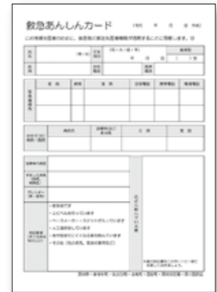
▲救急あんしんカード(見本)

「救急あんしんカード」に記載した内容は、年に1回以上は見直しをするようにしましょう。