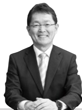
深川市長 田中昌幸