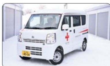
▲赤十字災害救援車「博愛号」

日本赤十字社北海道支部から赤十字災害救援車「博愛号」が日赤深川市地区に再配置されました。車両は今後、災害発生時に毛布などの救援物資の運搬や避難所間の情報伝達などに活用します。