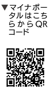
ポーチマイナはらからコード