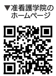
准看護学院のホームページ