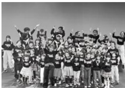
▲み・らいダンス公演「みんなで踊ろう!」の様子(令和6年3月17日)