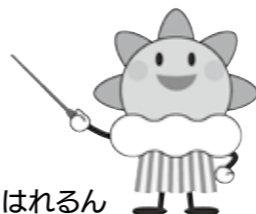
気象庁マスコット はれるん

◀気象庁ホームページ https://www.jma.go.jp/jma/kishou/known/bosai/keiho-update2026/