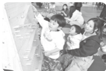
昨年の北海道の木育 木のおもちゃ体験の様子▶

❖時間 午前10時30分～午後1時30分 ❖内容 スーパーボールすくい・わなげ ❖問合先 深川市を緑にする会事務局 (☎番窓口/都市建設課内 ☎26-2304)