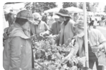
◀昨年の園芸市の様子