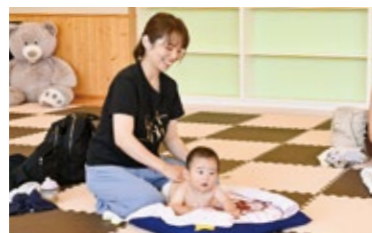
▼ベビーマッサージの様子(令和7年6月19日)