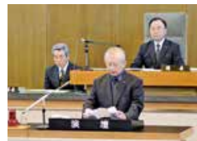
▲第2回臨時会で行った追悼演説