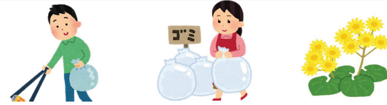
新星町内会 町内会館の除草剤散布、草刈り

☆こちらも、ご協力よろしくお願いします。 市と当会では毎年期間を定め、官民一体となって市内一斉の大掃除を実施しています。令和5年度は次のとおりです。 ◎春の大掃除期間：6月15日～6月21日 ◎秋の大掃除期間：9月14日～9月20日