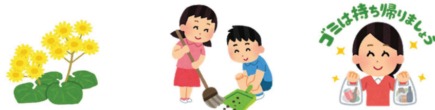
広里第2町内会 草刈り

この他に、北仲1・2丁目、3丁目、駅前、一北星、三北星、二十四孝、8区の2、音江第4の各町内会がそれぞれ取り組んでいます。 きれいなまちづくりにご協力いただきありがとうございました。