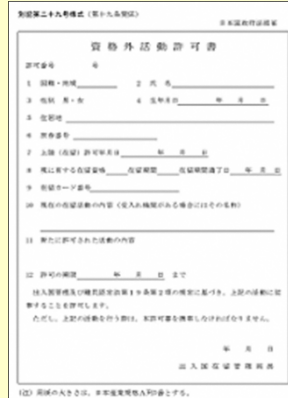
※3 資格外活動許可書