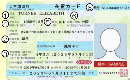
在留カード例（表面）