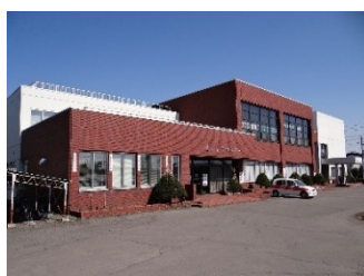
総合福祉センター