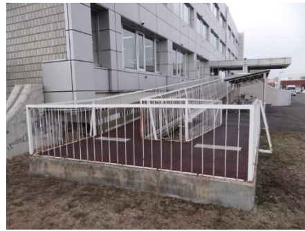
車いす用スロープ