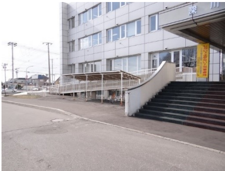
正面玄関階段と車いす用スロープ

加えて、市民が気軽に集えるスペース等がないため、市役所は「必要な用事を済ませた後は直ちに帰るところ」となっており、市民との協働スペースや市民に親しまれる集いの場づくりが求められています。