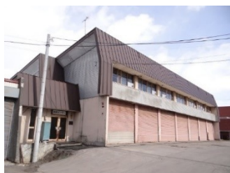
克雪車両センター