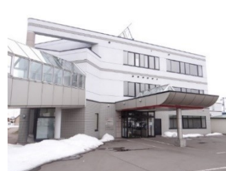
健康福祉センター (デ・アイ)