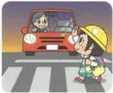
歩行者を優先しよう! 早めにライトを点灯しよう!