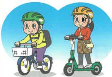
ヘルメットを着用しよう!