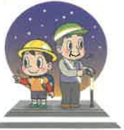
左右を確認しよう!