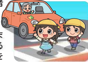
横断歩道は歩行者優先

横断歩道は歩行者優先です。運転者には横断歩道手前での減速義務や停止義務があります。歩行者の横断を妨げないようにしましょう。歩行者や他の車両に対する「思いやり・ゆずり合い」の気持ちを持って運転しましょう。