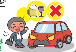
飲酒運転は絶対ダメ！

飲酒運転やあおり運転（妨害運転）は極めて悪質で危険な犯罪です。アルコールは少量の摂取でも安全運転に必要な情報処理能力、注意力、判断力などを低下させ、交通事故の危険を高めます。お酒を飲んだら絶対に車を運転してはいけません。あおり運転もやめましょう。