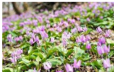
円山公園のカタクリ群生地