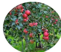
果樹園のリンゴ狩り