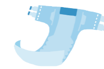
◎ テープ止めタイプ 1枚/日