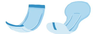
◎ 尿取パッド(昼用) 2～3枚/日 ◎ 尿取パッド(夜用) 1枚/日