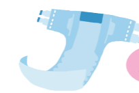
◎ テープ止めタイプ いずれか ◎ パンツタイプ 1枚/日