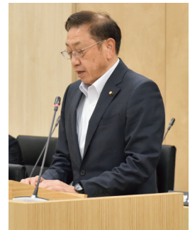
宮澤複合施設整備特別委員長