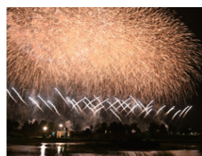
2023ふかがわ夏まつり花火大会