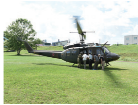
平成29年に実施した防災総合訓練の様子

◎ 台風や地震等の自然災害により、全国各地で毎年多くの被害が発生している。防災拠点機能を有する災害に強い新庁舎は本年10月10日に開庁するが、市として防災総合訓練を実施する考えについて伺う。