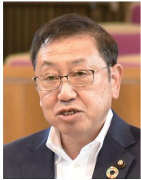
みやざわ たかし 議員 宮澤孝司 議員 「令和公明クラブ」