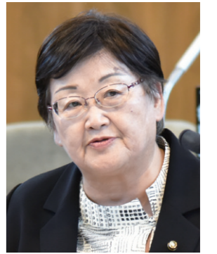
まつばら こと 松原やす子 議員 「日本共産党」