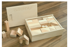
乳児に対する地場産木材を使用した積み木の配付事業