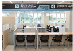
新庁舎に開設されたおくやみ窓口

◎ 前立腺がん等に罹患された方は、外出先で尿漏れパッドを使用する際、使用済みパッド等を捨て