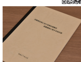
福祉避難所設置運営に関する協定書

◎ 福祉避難所は、指定避難所で避難生活を送ることが困難な高齢者、障がい者、妊産婦などの要援護者がいた場合、災害対策本部が福祉避難所の開設と避難の考え方を伺う。