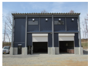
有害鳥獣処理施設