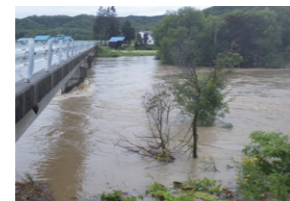
令和5年8月の大雨による河川の増水