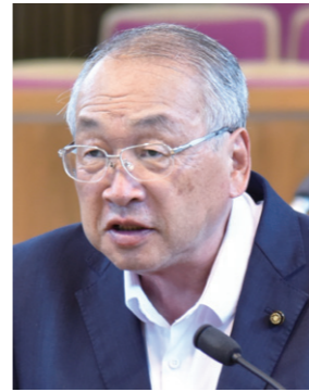
ささき かずお 議員 佐々木一夫 議員 「れいわ新選組」