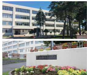
深川西高校・深川東高校