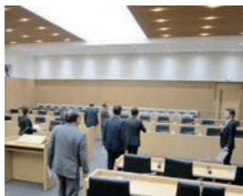
機能的な議場設備

新庁舎は、「保健センターなどが入った複合庁舎」、「災害に強い庁舎」、「再生可能エネルギーを使用した省エネ庁舎」、「バリアフリー庁舎」の4つの大きな特徴があり、それぞれの機能について説明を受け、基本計画策定までの経過や、改築費用などを調査しました。