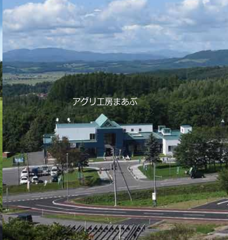
アグリ工房まあぶ