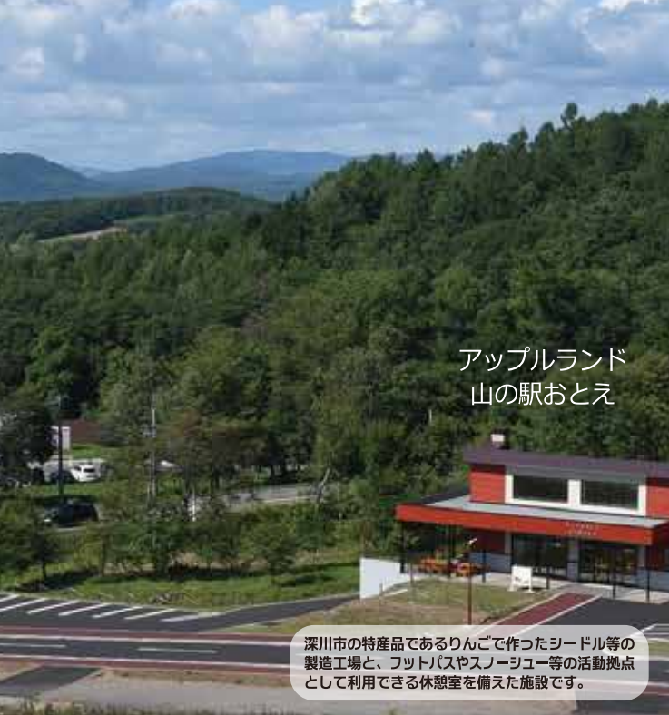
アップランド 山の駅おとえ

深川市の特産品であるりんごで作ったシールド等の製造工場と、フットバスやスノーシュー等の活動拠点として利用できる休憩室を備えた施設です。