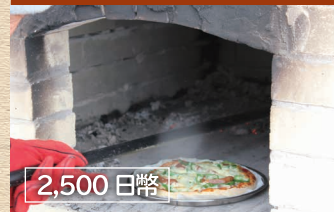
石釜 (附營火木材 2 束)