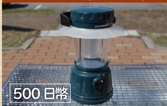
LED 提燈 (附電池)