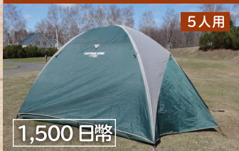
巨蛋型帳篷 (CAPTAIN STAG)

※費用：5,000 円日幣 + 門票 ※開放日期：5 月上旬 ~ 10 月 31 日 ※租借用品 帳篷・天幕・睡袋・木炭・爐子 桌子・椅子・各種料理器具・提燈 ※帳篷的組裝會有工作人員一同協助。 ※椅子、睡袋最多可提供 5 人份。 提燈最多可提供 2 個。