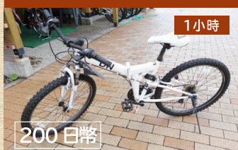
登山車 (大人・小孩)