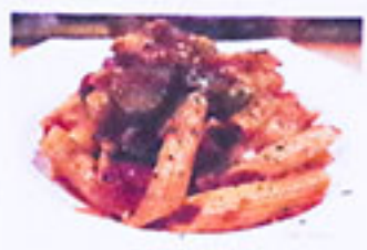
なすとツナの ピリ辛トマトソース