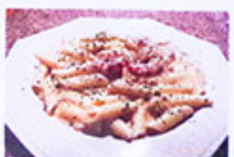
エビとホタテの トマトクリームソース