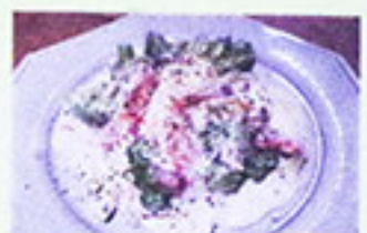
鮭とブロッコリー