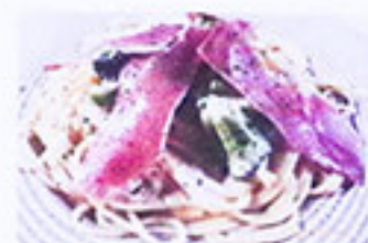
ブロッコリーと生ハム