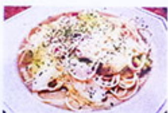
キャベツとベーコン