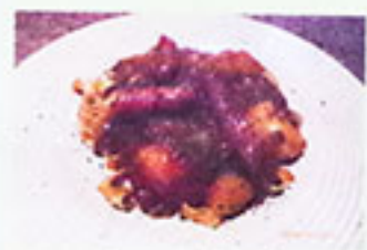
ソーセージとポテト