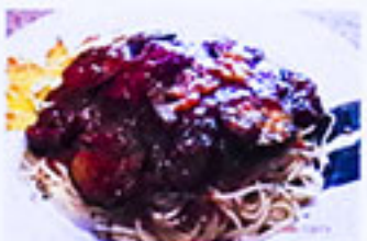
なすとズッキーニの ミートソース