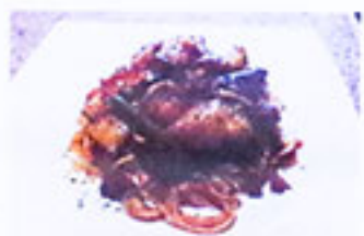
野菜のトマトソース