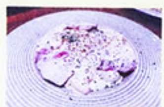
ブロッコリーと ベーコン