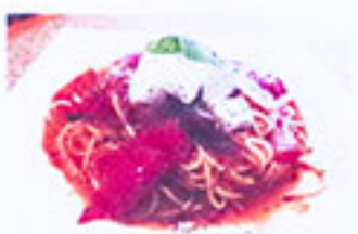
トマトと モッツアレラチーズ