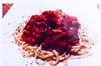
ツナのトマトソース