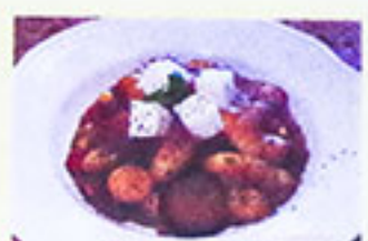
野菜と モッツアレラチーズ