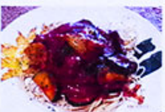
なすとズッキーニの トマトソース