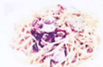
ポルチーニ茸とクルミ