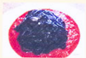
イカスミの トマトソース添え