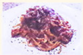
ワタリガニの トマトソース