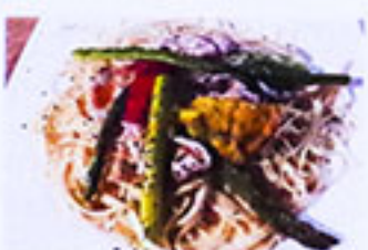
豚しゃぶとアスパラ