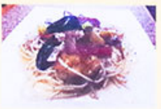
海の幸の カラスミのせ