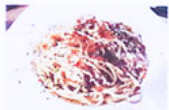
シーフードラグーの カラスミがけ