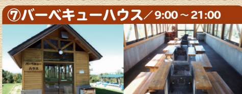
⑦バーベキューハウス / 9:00 ~ 21:00

手作りのピザなどが楽しめる「石窯」があります。キャンプの思い出作りにはもってこいの設備です。