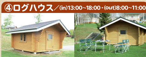
④ログハウス / (in)13:00~18:00・(out)8:00~11:00

車を横付けして、ゆったりとしたスペースでテントを張れ、電源・水道・野外テーブルの設置されたカーサイトや、大型キャンピングカーが直進して駐車できるキャンピングカーサイトに加え、手ごろな価格のフリーテントサイトを完備しています。