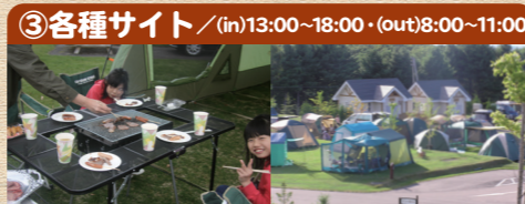
③各種サイト / (in)13:00~18:00・(out)8:00~11:00

最大定員5人・8人・11人の3タイプ、全6棟のコテージがあり、バス、トイレ、システムキッチン、食器類、テレビ、寝具、冷暖房を完備しています。バリアフリーのコテージ(F棟)もあります。