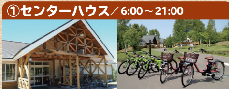
①センターハウス / 6:00 ~ 21:00

ご利用の方はこちらで受付してください。トイレ・シャワールーム・ランドリー・売店・携帯電話充電器・自動販売機を設置しています。また、レンタサイクルの受付もこちらになります。