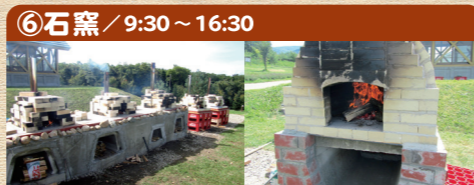
⑥石窯 / 9:30 ~ 16:30

キャンプ場内に愛犬と運動ができるドッグランを併設しています。広々とした芝生で愛犬に思いきり運動をさせてみませんか。