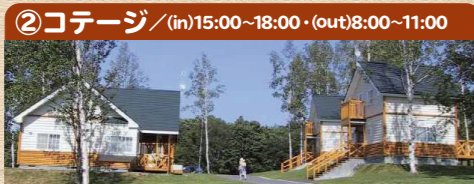
②コテージ / (in)15:00~18:00・(out)8:00~11:00

ご利用の方はこちらで受付してください。トイレ・シャワールーム・ランドリー・売店・携帯電話充電器・自動販売機を設置しています。また、レンタサイクルの受付もこちらになります。